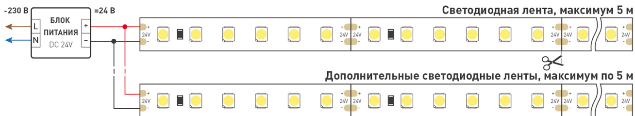
Схема 1. Подключение нескольких светодиодных лент с одной стороны.

Максимальная длина подключения ленты – 5 м (1 катушка).