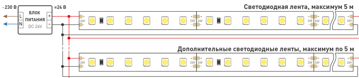
Схема 2. Подключение нескольких светодиодных лент с двух сторон.

Рекомендуется использовать для обеспечения равномерного свечения ленты по всей длине.